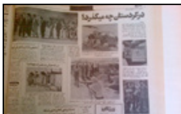
اعدام در سنندج. صف دستگیرشدگان به زندان برده می شوند. اطلاعات، ۸ شهریور ۱۳۵۸