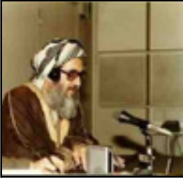
شیخ عزالدین حسینی