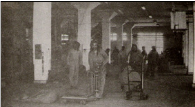
کارگران دخانیات در شهر سقز. دخانیات در سال ۱۳۳۹ شمسی با حدود سیصد کارگر و کارمند مورد بهره‌برداری قرار گرفت. عکس از کتاب سقز.

در استخدام خود داشت. ۶۰ برنامه سوم سازمان برنامه کمبودها و نارساییها در این زمینه را به رسمیت شناخته بود: استاندارد پایین خانه‌ها و فقدان تسهیلات حیاتی در مناطق مسکونی از جمله امکانات اجتماعی و عمومی. این نارساییها و کمبودها در سالهای دهه ۱۳۵۰ نیز همچنان ادامه داشت. بخش خصوصی در کردستان به اجرای پروژه‌های ساختمان‌سازی در مناطق مسکونی و پادگانها دست زد که ایجاد مسکن برای کارمندان صادر شده دولتی به شهرهای کردستان یکی دیگر از اهداف آنها را تشکیل می‌داد.