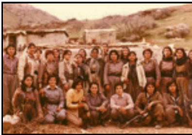
زنان در صفوف کومه‌له، ۱۳۶۳.