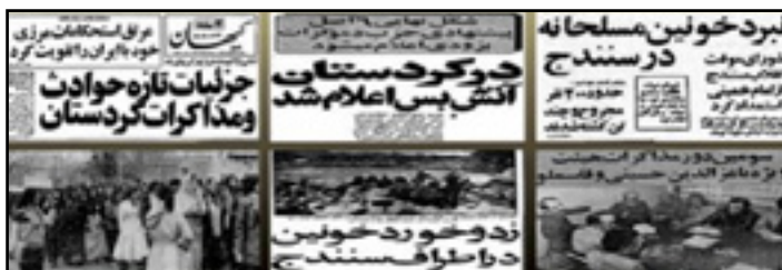
بریده‌هایی از روزنامه‌های روز که حوادث کردستان را منعکس می‌کند