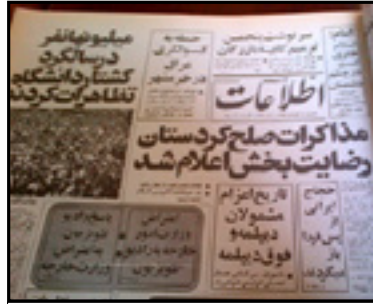
مذاکرات صلح با «ضد انقلاب» بدنبال اعتصاب عمومی در کردستان: اطلاعات، یکشنبه ۱۳ آبان ۱۳۵۸