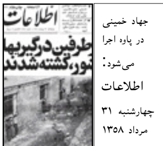
جهد خمینی در پایه اجرا می شود. اطلاعات چهارشنبه ۳۱ مرداد ۱۳۵۸