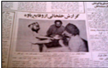
«آیت الله خلخالی، پیش از محاکمه صحرايي...»: روزنامه اطلاعات، پنجشنبه، اول شهریورماه ۱۳۵۸