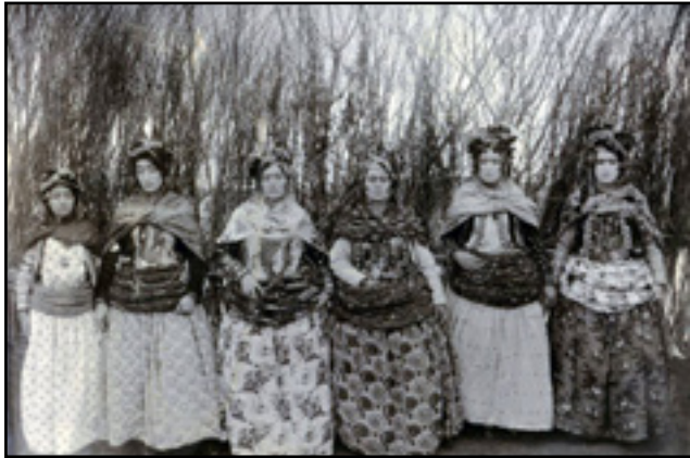
همسران آغاها یا اربابان در سقز ۱۹۱۰.

کردستان بدنبال انقلاب، نتیجه سالها مشارکت و فعل و انفعال آنان با جامعه‌ای در حال تحول را به نمایش می‌گذاشت.