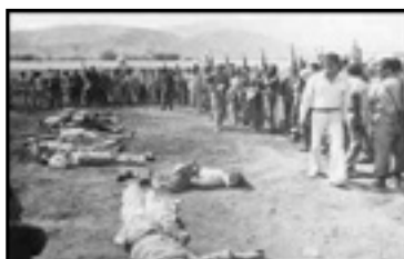
پاسداران «پیروزی» خود را جشن می گیرند: اعدام شدگان سنندج، شهریور ۱۳۵۸