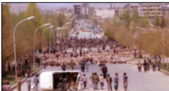
مردم سنندج در برابر حمله ارتش و سپاه پاسداران به سنگر بندی اقدام می‌کنند. جنگ ۲۴ روزه سنندج در بهار ۱۳۵۹