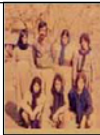
زنان در صفوف حزب دمکرات. دهه ۱۳۶۰

میلیتاریزه کردن کردستان در سالهای ۱۳۵۸ و ۱۳۵۹ پیشمرگ‌گاییتی (مبارزه مسلحانه) را بشیوه اصلی مقاومت در کردستان مبدل ساخت. زنان پیشمرگ در احزاب سیاسی در کردستان: محصول تحولات اجتماعی و سیاسی نیمه دوم قرن بیستم، انقلاب ۱۳۵۷ و جنبش مقاومت اول و دوم