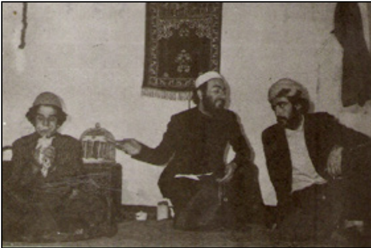
گسترش محبوبیت تئاتر در سالهای دهه ۱۳۵۰.

آموزشی در یک جامعه اشاره کردیم. با آوردن مثالی از انگلستان متوجه شدیم که تغییرات در آموزش و پرورش در قرن نوزدهم و تعیین اهداف جدید برای آن بازتاب مستقیم تغییرات در جامعه، تقسیم‌بندیها در آن، نیازهای جدی، و همچنین نتیجه فشارهای عناصر جدید (صنعت و دموکراسی) بود. اما همچنانکه ویلیامز خاطر نشان می‌کند اینکه «نیازهای یک عضو آگاه و فعال یک نظام دموکراتیک» کدامند به هدف اصلی آموزش [در انگلستان] تبدیل نشد. چنین انتظاری از مدرنیزاسیون پهلوی در حیطه آموزش و فرهنگ، البته غیر واقعی و خیالی بود.