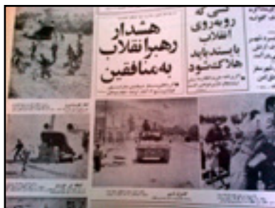
تانکها و نیروهای ارتش و سپاه با هشدار رهبر انقلاب وارد کردستان می شوند. روزنامه اطلاعات، سوم شهریور ۱۳۵۸