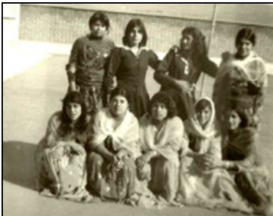
دختران دبیرستان پرورش در سقز، سال ۱۳۵۷. عکس: شهناز شهلایی

http://kurdistan.photoshelter.com/gallery/Hussein-Yazdanpana-Archives-Old-pictures-of-Iranian-Kurds/G0000q4trLwDdoQ ,