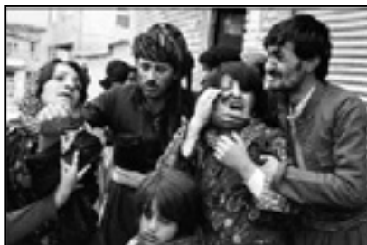
مردم در سوگ بستگانشان. جنگ ۲۴ روزه سنندج