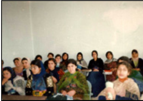
دانش‌آموزان دختر با معلم خود با لباس کردی در سر کلاس حاضر می‌شوند. دبیرستان آزادی (کوثر)، سال ۱۳۵۸.