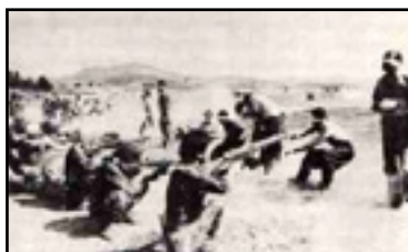
اعدام در فرودگاه سنندج شهریور ۱۳۵۸